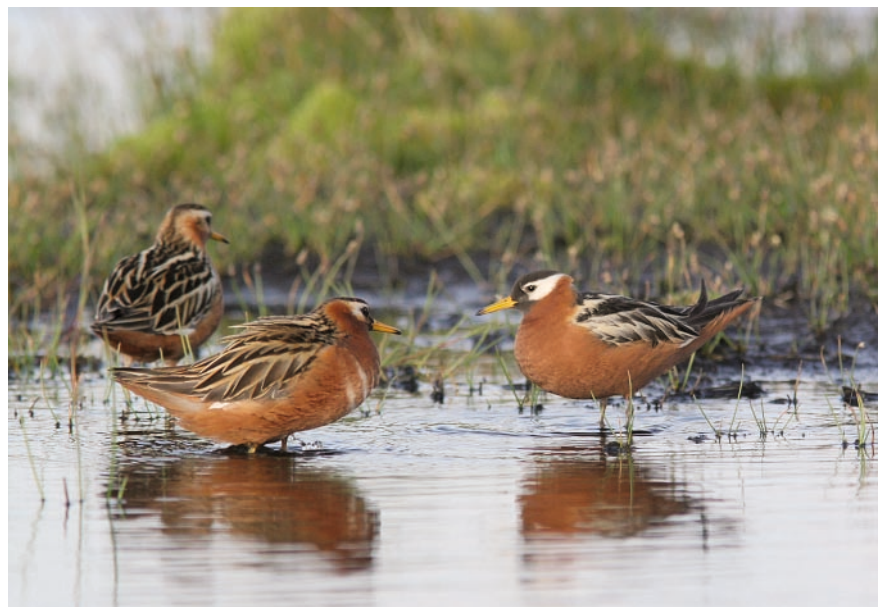
1. mynd. Þórshanakerling (t.h.) í fylgd tveggja karlfugla. Paraði karlfuglunnar yfir bakfjaðrirnar til að bæjja utanaðkomandi karlfuglinum frá. – Three Red Phalaropes, a female (right hand bird) and two males. – Yann Kolbeinsson.

auk Íslands. Vetrarstöðvarnar eru ekki eins vel þekktar, því að tegundin heldur til á rúmsjó á mótum stórra hafstrauma þar sem næringarefni streyma upp til yfirborðs. Helstu vetrarstöðvar þórshana sem þekktar eru í dag eru í Humboldt straumnum undan ströndum S-Ameríku og í Kanarí og S-Gíneu straumakerfunum undan ströndum V-Afríku. Einnig finnast þeir í einhverjum mæli í Benguela hafstraumnum undan ströndum SV-Afríku (Tracy o.fl. 2002). Líklegt þykir að íslenski stofninn hafi vetursetu undan ströndum V-Afríku þó engar beinar vísbendingar séu til um það. Í raun má því segja að þórshani sé sjófugl þar sem hann eyðir hátt í 10-11 mánuðum ársins á sjó. Hingað til lands koma fyrstu fuglarnir í þriðju viku maí, síðastir íslenskra farfugla, en stærstur hluti stofnsins virðist þó koma í fyrstu viku júní. Varpatferli sundhana er sérkennilegt, kvenfuglarnir eru litskrúðugra kynið (1. mynd) og sjá karlfuglarnir einir um útungun og ungauppeldi. Kvenfuglarnir geta því hæglega makast við fleiri en einn karlfugl og er slíkt kallað fjölveri. Slíkt hegðun er aðeins þekkt hjá innan við 1% allra fuglategunda í heiminum (Ward 2000). Sökum þessa félagsatferlis eiga kvenfuglarnir þess kost að yfirgefa landið á undan karlfuglunum, jafnvel í seinni hluta júní, eftir aðeins 3-4