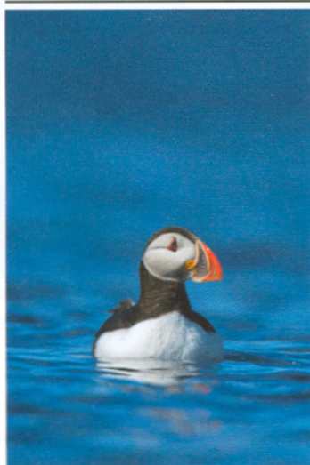
Lundi ( Fratercula arctica ).

Friðun yrði svo aflétt í áföngum (t.d. með lengingu veiðitíma) eftir að stofninn sýnir batamerki.