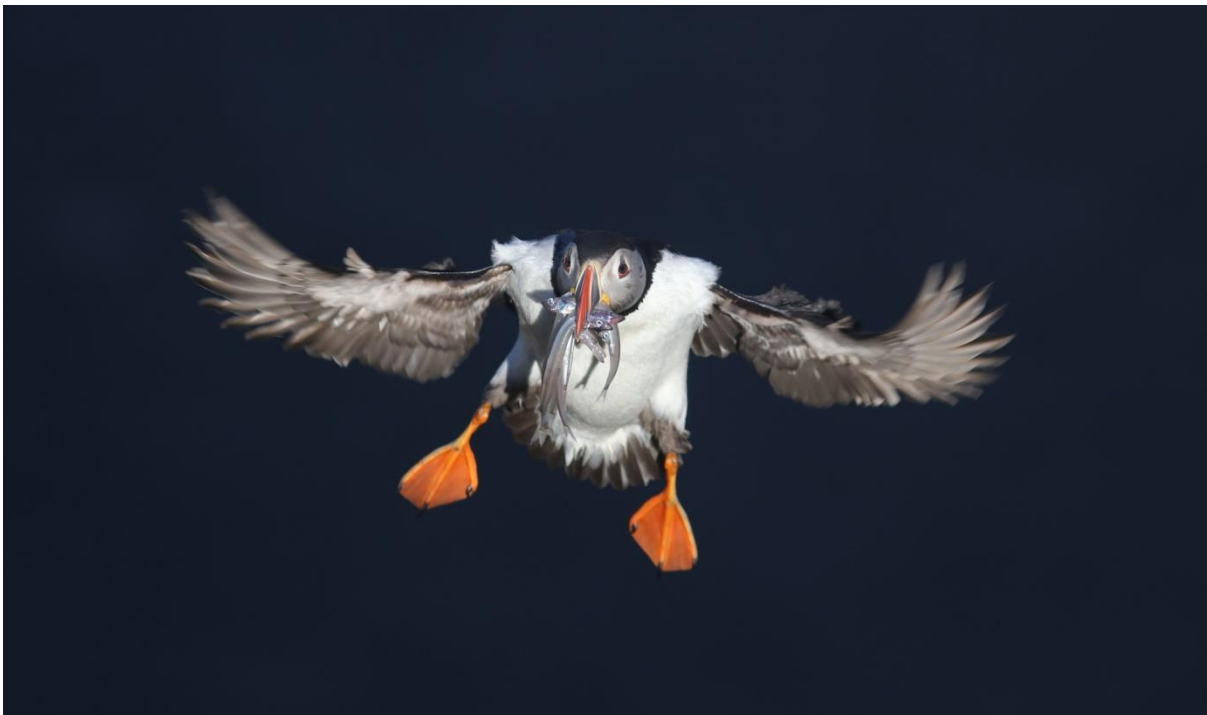
Lundi að bera fæðu í unga í júlí 2016 í Hafnarhólma, Borgarfirði Eystra.